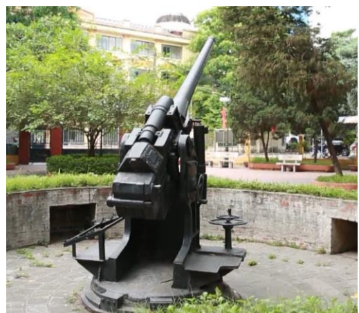
Di tích pháo đài Láng