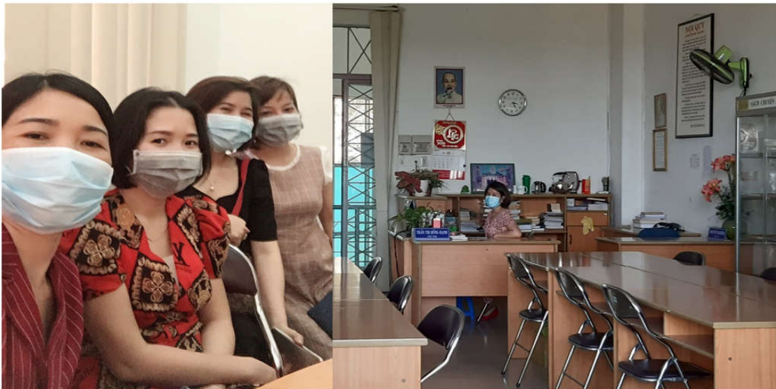
Cán bộ viên chức thực hiện đeo khẩu trang khi hội họp và tiếp xúc với độc giả

Thực hiện sự chỉ đạo của Bộ Văn hóa Thể thao và Du lịch tỉnh Đồng Nai; Vụ thư viện; Sở VH TT & DL tỉnh Đồng Nai, Thư viện tỉnh Đồng Nai đã triển khai kế hoạch phòng, chống dịch bệnh Corona đến từng cán bộ, đảng viên chi bộ, tổ chức công đoàn, tiếp đó là từng CBVC, người lao động của đơn vị. Thực hiện trang bị nước rửa tay tại các cửa ra vào trụ sở làm việc, trong nhà vệ sinh, tại các phòng ban; phát khẩu trang cho cán bộ viên chức, người lao động; trang bị máy đo thân nhiệt; thông tin tuyên truyền nhắc nhở CBVC, người lao động đơn vị giữ gìn sức khỏe; thực hiện các cách phòng chống dịch bệnh thường xuyên; dán thông báo về quy định ra vào thư viện; tuyên truyền trong cán bộ không nên đăng tải, chia sẻ những thông tin loan truyền về dịch bệnh không chính xác; cách ly cán bộ, viên chức khi có những triệu chứng ho, sốt,...; đặc biệt nhắc nhở độc giả và hướng dẫn tỉ mỉ cách đeo khẩu trang, quy trình rửa tay, rồi tuyên truyền mọi người hạn chế tụ họp nơi đông người, che miệng khi ho, hắt hơi... khi vào thư viện; không nên hoang mang tích trữ nhiều lương thực gây thiếu hàng hóa, dẫn đến giá cả thị trường leo thang, gây khó khăn cho nền kinh tế cả nước.