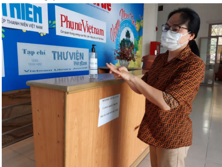
Cán bộ viên chức Thư viện tỉnh thực hiện nghiêm túc các quy định về phòng chống dịch

Hiện nay, dịch bệnh viêm đường hô hấp cấp do virus Corona (nCov) gây ra đang làm ảnh hưởng đến cuộc sống và sinh mệnh của con người. Theo thống kê của Bộ Y tế, đến thời điểm hiện tại đã có hơn hơn 200.000 người của hơn 200 quốc gia và vùng lãnh thổ trên thế giới trong đó có Việt Nam đã nhiễm bệnh. Tính đến cuối tháng 03 đã có hơn 20.000 người tử vong vì dịch bệnh, vẫn chưa dừng lại ở đó, số người chết đang gia tăng hàng ngày. Chính vì vậy, vào giữa tháng 3 vừa qua, Tổ chức Y tế thế giới (WHO) đã công bố căn bệnh viêm đường hô hấp cấp (Covid-19) do chủng mới của vi rút corona gây ra là “đại dịch toàn cầu”.