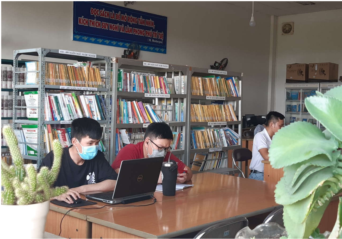
Độc giả thực hiện đeo khẩu trang khi vào thư viện