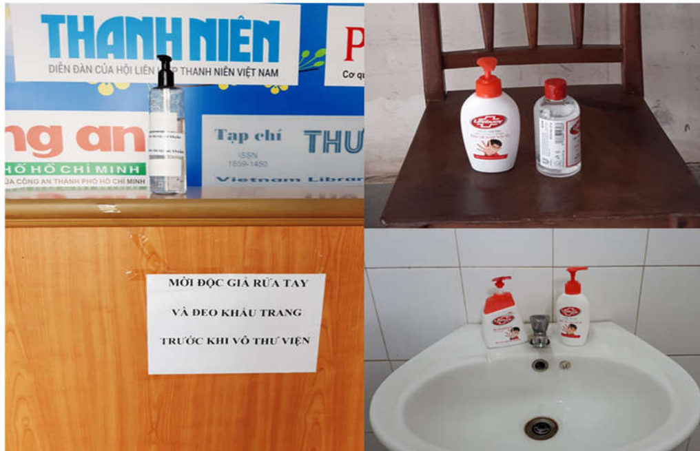
Thư viện trang bị nước rửa tay và lời nhắc nhở rửa tay, đeo khẩu trang khi ra, vào đơn vị