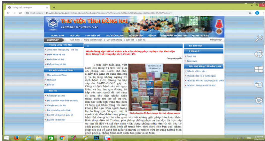
Trên website của thư viện tỉnh đăng tải những bài viết giới thiệu sách về các cách phòng, tránh dịch bệnh

được tiếp nhận thêm một “phương thức truyền thông” về dịch bệnh, bên cạnh đài phát thanh phường và tin tức báo chí, internet, mạng xã hội.