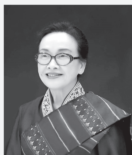
Bà Naly Sisoulith, Phó nhân Tổng Bí thư, Chủ tịch nước Lào Thongloun Sisoulith.